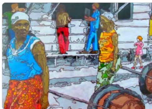
A Maré do anos 70, revisitada pelo pintor Chico Moreira (Crédito: Divulgação)

» Matérias 25.09.2012 deixe aqui seu comentário